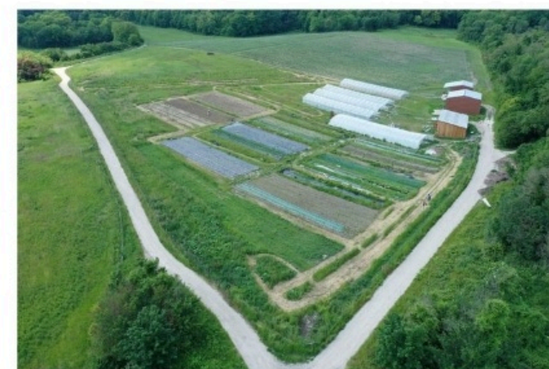
AGRICULTURE BIOLOGIQUE À CHELLES